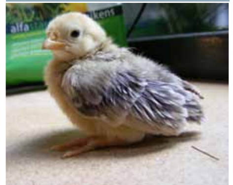
Blauw koekoek Seramakuiken.

Het is makkelijker een slechte Serama te fokken dan een mix die eruit ziet als een Serama