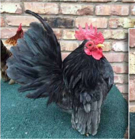
Blauwen, zomaar gefotografeerd januari 2014 bij Jerry voor dit artikel.