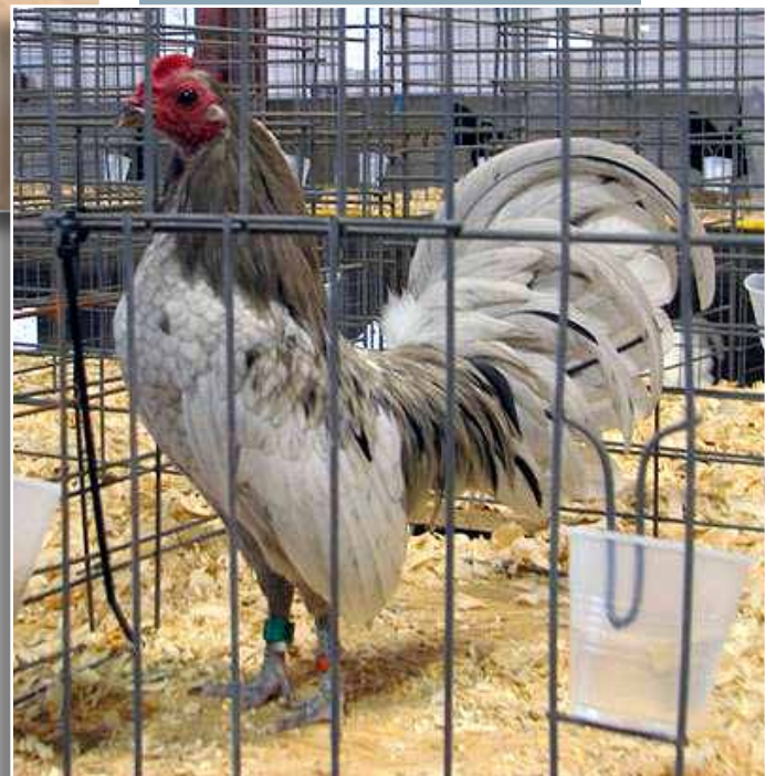
Rechts: Splash OEGB van SunnyChick Florida (Newman Show).