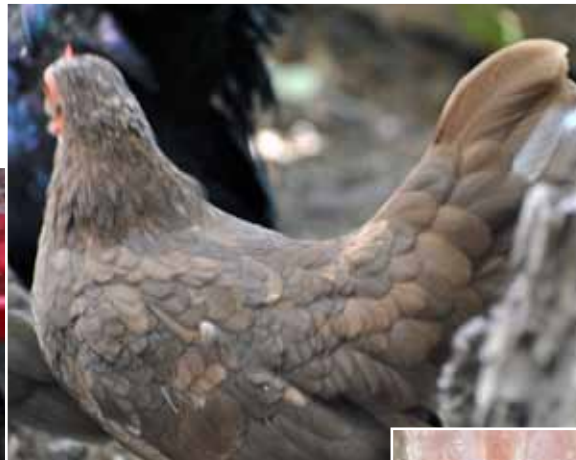
Per ongelukke foto: blauw x choc/brons experiment is ook door Jerry gedaan (deels rechts), moeder is blauwe (links), 2013/14.