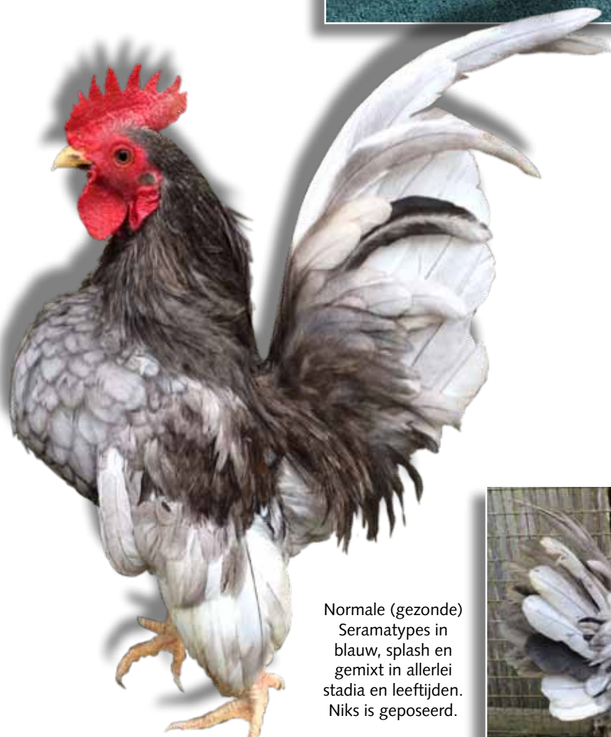
Normale (gezonde) Seramatypen in blauw, splash en gemixt in allerlei stadia en leeftijden. Niks is geposeerd.