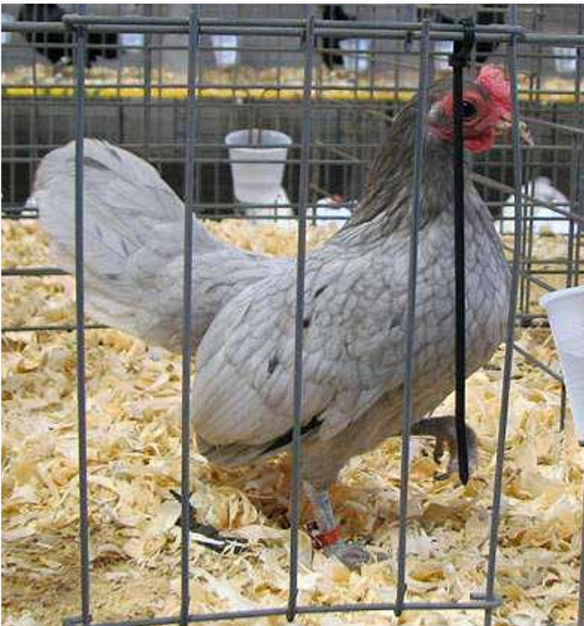
Splash OEGB hen van SunnyChick Florida.